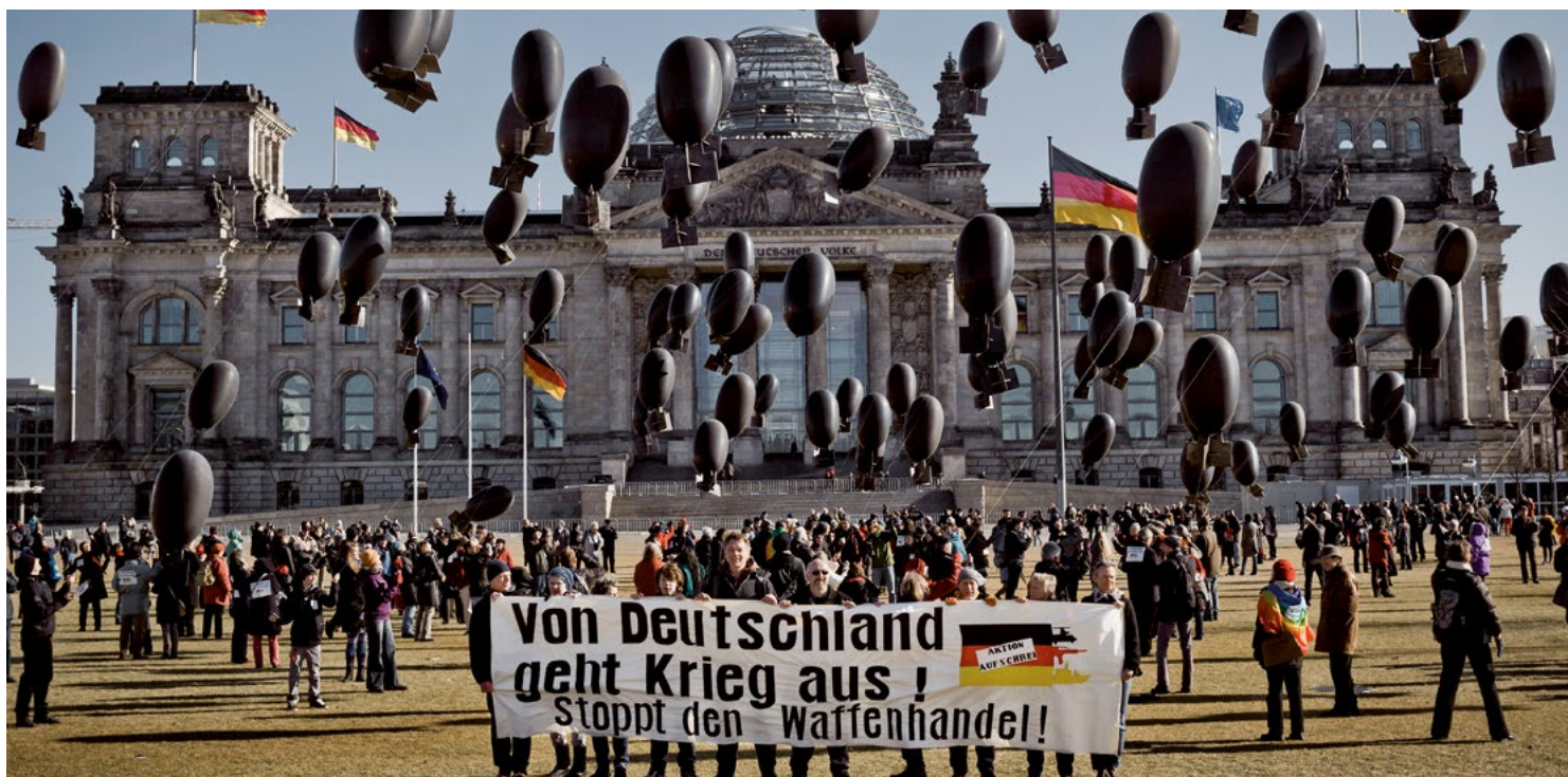
Protestaktion vor dem Reichstag der „Aktion Aufschrei - Stoppt den Waffenhandel“, einem Bündnis von über 100 Organisationen aus Zivilgesellschaft und Kirchen

von Konfliktpartien eingesetzt wurden. 121 Ab 2018 gab es dann laut Rüstungsexportbericht der Bundesregierung einen starken Rückgang der Exporte von Kleinwaffen in Drittländer. Dies ist eine positive Entwicklung, die aber auch nicht überbewertet werden sollte: Denn zum einen handelt es sich hierbei nur um Kleinwaffen nach der engen Definition der Bundesregierung (bei der u.a. alle Pistolen und bestimmte Gewehrarten fehlen). Zum anderen gab es 2019 einen neuen Rekordwert (fast 70 Millionen Euro) bei der Genehmigung von Kleinwaffenexporten insgesamt, so dass es vermehrt zu Re-Exporten deutscher Kleinwaffen aus EU- oder NATO-Staaten in Drittstaaten kommen kann – wie in der Vergangenheit immer wieder geschehen