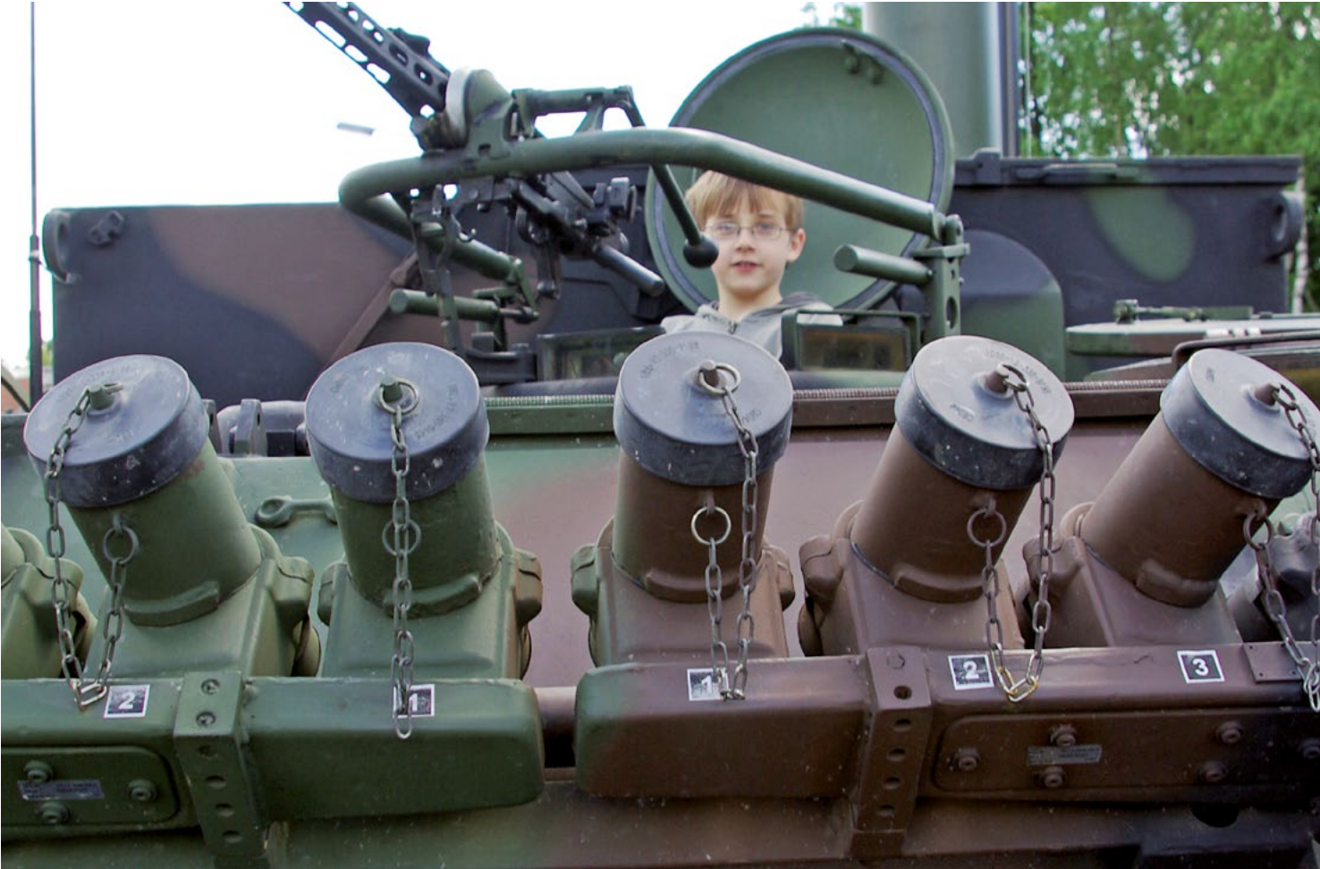
Kinder dürfen bei Bundeswehr-Veranstaltungen in Panzer oder Hubschrauber steigen

Deutlich wird dies im Falle der jugendgerechten aufgearbeiteten Webseiten der Bundeswehr. Bereits die diskurslinguistische Analyse von Vogel (2014) kam zu dem Ergebnis, dass die Internet-Präsenz der Bundeswehr Stereotype, Emotionen, und Bedürfnisse von jungen Menschen in einem idealisierten Image kanalisiert, verbunden mit der Message: „Komm' zur Bundeswehr!“. Auch auf der aktuellen Website bundeswehrentdecken.de werden solche Images produziert und wird aktiv für die Bundeswehr geworben. Dort lässt sich beispielsweise das Jugendmagazin „BE Strong. Die Infopost der Bundeswehr“ kostenlos bestellen, das vom Presse- und Informationsstab des Bundesministeriums für Verteidigung herausgegeben wird. Das Jugendmagazin beinhaltet viele Hinweise zu den Berufsmöglichkeiten bei der Bundeswehr und zeugt deutlich die Absicht, junge Menschen für den Arbeitgeber Bundeswehr zu begeistern.