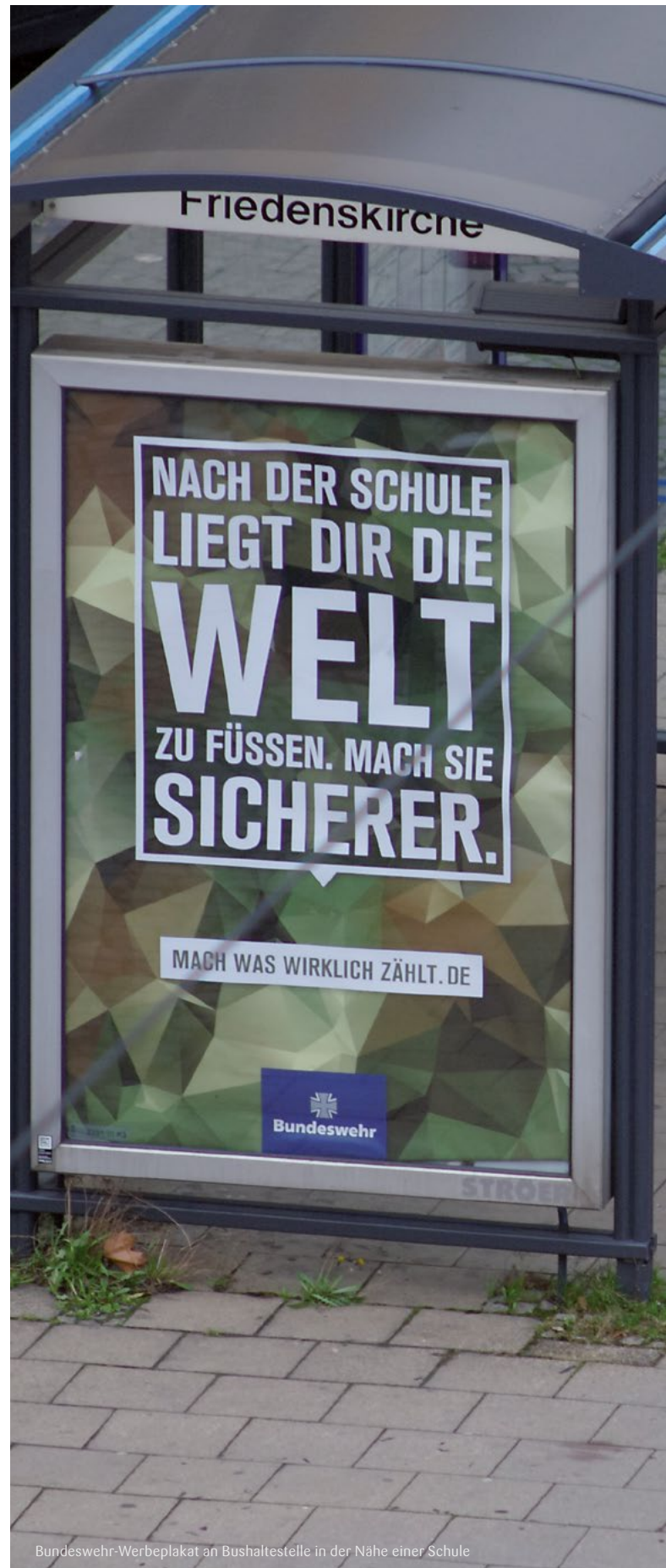
Bundeswehr-Werbepplakat an Bushaltestelle in der Nähe einer Schule

Umgekehrt weist der Wehrbeauftragte aber auf – 63 (2016), 167 (2017) und 150 (2018) – gemeldete Vorfälle in der Kategorie „Verdacht auf Gefährdung des demokratischen Rechtsstaates, unzulässige politische Betätigung und Volksverhetzung“ hin. Vorwiegend handle es sich hierbei um Propaganda-Delikte wie ausländerfeindliche und antisemitische Äußerungen, das Hören rechtsextremistischer Musik, Hakenkreuzschmierereien, das Zeigen des verbotenen „Deutschen-Grußes“, „Sieg-Heil“-Rufe sowie die Nutzung gespeicherter Bilder, Texten oder Musik mit extremistischen Inhalt. 51 Sofern diese Vorkommnisse gemäß dem Grundprinzip der Inneren Führung nicht konsequent gemeldet, geahndet und unterbunden werden, setzt dies gerade minderjährige Soldatinnen und Soldaten einem erheblichen Meinungsdruck aus – und beeinträchtigt die Persönlichkeitsentfaltung im Geiste der in der Charta der Vereinten Nationen und der Kinderrechtskonvention verkündeten Ideale. Generell stellt sich die Frage, ob im Rahmen einer militärischen Ausbildung das Recht auf Bildung im Geiste von Frieden, Toleranz und Freundschaft zwischen den Völkern stets gewährt werden kann.